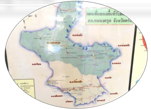
๒.แผนที่สถานการณ์