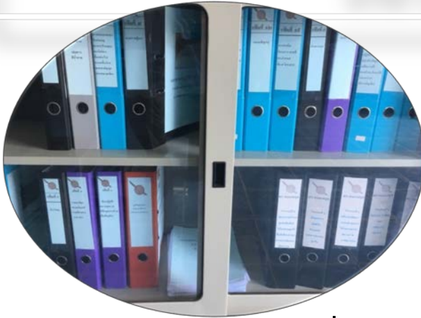
1. ข้อมูลสำคัญและข้อมูลท้องถิ่น ภายในห้องศูนย์ปฏิบัติการ