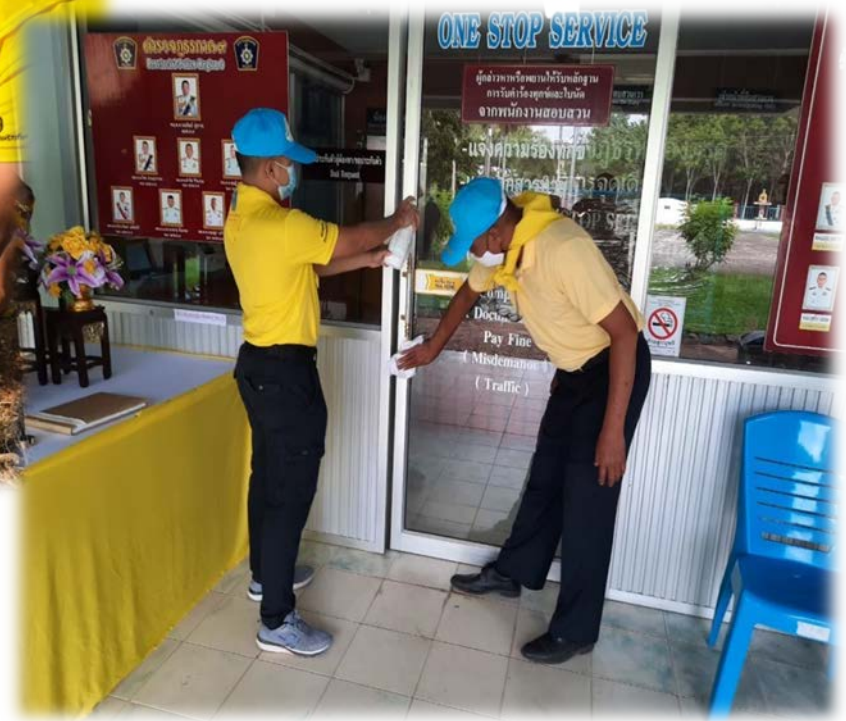
จัดกิจกรรมจิตอาสาภายใน สภ.หนองตรุด